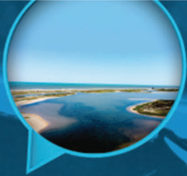
LAGOA DA SOMBRINHA